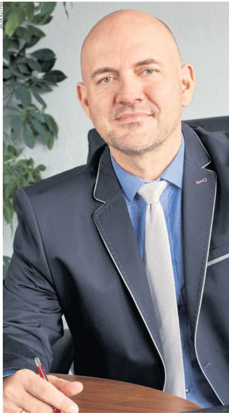
KPAI Sp. z o.o. została wyróżniona w krajowym etapie konkursu Europejskiej Nagrody Promocji Przedsiębiorczości 2016, którego organizatorem jest w Polsce Ministerstwo Rozwoju

- Oczywiście, szczególnie w takim dniu jak ostatnia środa, jest i satysfakcja. Czerpiemy ją i z tego, że