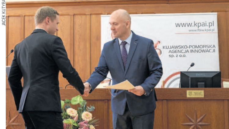
16.10.2018 r. w Sali 215 Urzędu Marszałkowskiego w Toruniu miało miejsce uroczyste wręczenie umów grantobiorcom

Nowatorskie pomysły zgłaszane przez przedsiębiorców powinny się również wpisywać w zakres tzw. inteligentnych specjalizacji, czyli obszarów działalności gospodarczej preferowanych pod kątem wspierania innowacyjności w regionie. Każde województwo wybiera własny zakres takich specjalizacji, kierując się przede wszystkim swoimi tradycjami i profilem gospodarczym, posiadanymi zasobami (w tym infrastrukturą), potencjałem naukowo-badawczym oraz określoną wizją rozwoju. W przypadku województwa kujawsko-pomorskiego wybrano pięć tego rodzaju obszarów, to: zdrowa i bezpieczna żywność, zdrowie i turystyka zdrowotna, zaawansowane materiały i narzędzia, transport i mobilność oraz dziedzictwo kulturowe i przemysły kreatywne.